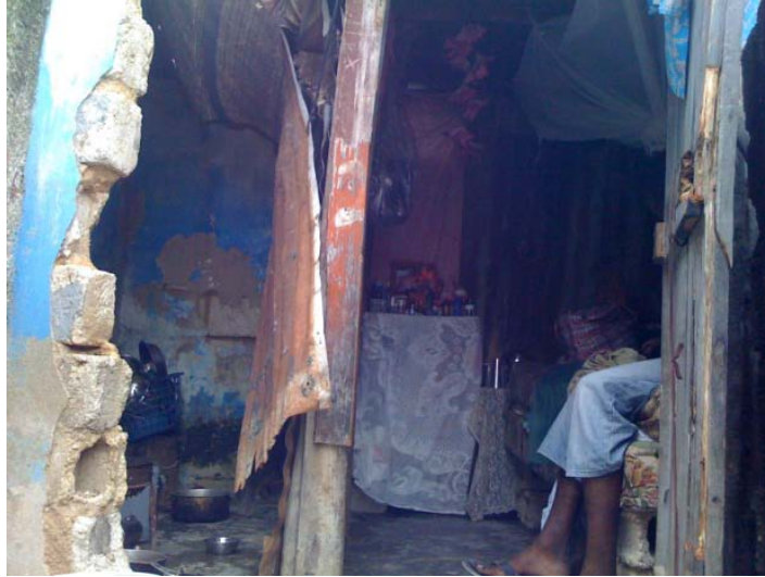
Façade principale de la maison où vit la mère de Raymonde LAMARRE