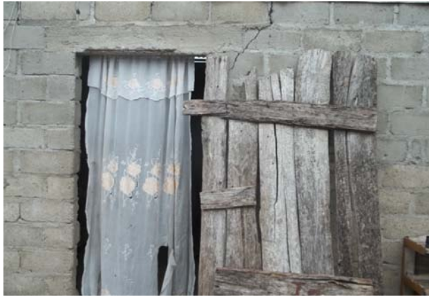
Porte d'entrée de la maison où vivent les enfants de la détenue