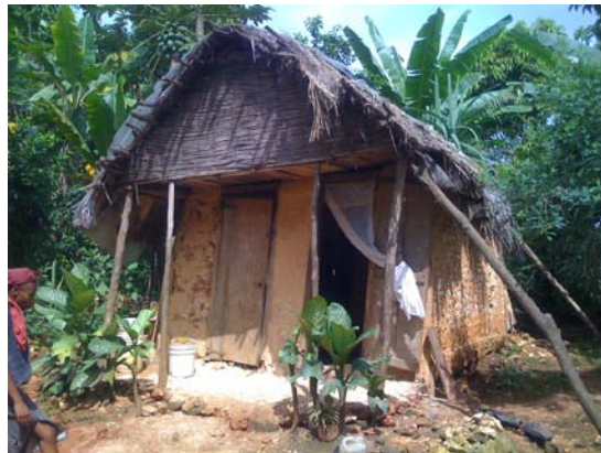
Chaumière où vivent 4 des enfants de Liphène JOSEPH, chez un cousin qui les a accueillis. Ils sont 14 à y vivre.

Aujourd'hui, les deux (2) ainées de Liphène JOSEPH vivent en domesticité. Son troisième enfant, âgé de dix-huit (18) ans, élève des animaux pour des personnes de la zone, en vue de payer son écolage. Il est en 5 ème année fondamentale.